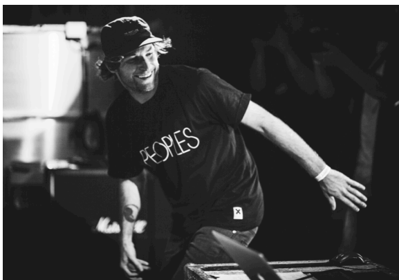
Mund de Carlo

Mund de Carlo er sproglig opfindsomhed og rap-teknisk overskud leveret til lyden af rå baggårdstrømmer, opløftende horn temaer og støvede stemningsfulde samples.